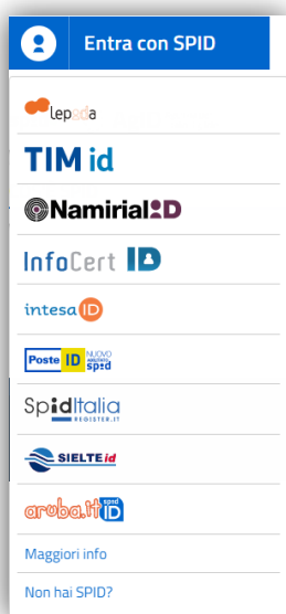
Figura 3 – elenco dei gestori d'identità accreditati dall'AgID

Occorrerà quindi selezionare il gestore con il quale si è effettuata la registrazione per il rilascio delle credenziali. (vedi paragrafo COME OTTENERE LE CREDENZIALI )