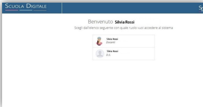
Figura 4 – Accesso a Scuola Digitale

Una volta terminati i passaggi propedeutici, propri dello SPID, il programma chiederà di selezionare il profilo utente con cui si desidera lavorare. Questa scelta si rende necessaria nel caso in cui l'utente abbia più profili accreditati (un docente che è anche genitore nello stesso istituto). Ovviamente, chi ha un'unica utenza, cliccherà sul solo profilo disponibile.