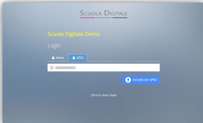
Figura 1 - Login di Axios Scuola Digitale con doppia opzione di accesso.

Una volta ottenuto lo SPID sarà sufficiente andare su https://scuoladigitale.axioscloud.it/ e scegliere di effettuare il login con SPID.